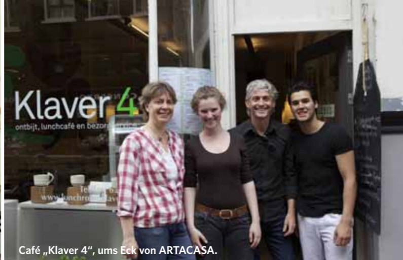
Café „Klaver 4“, ums Eck von ARTACASA.