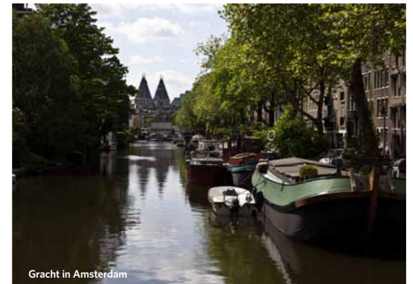
Gracht in Amsterdam

Van Gogh Museum, weltweit größte Van-Gogh-Sammlung, Paulus Potterstraat 7, Amsterdam, www.vangoghmuseum.nl The Frozen Fountain, Designermöbel und Accessoires von u.a. niederländischen Designern, Prinsengracht 645, Amsterdam, www.frozenfountain.nl