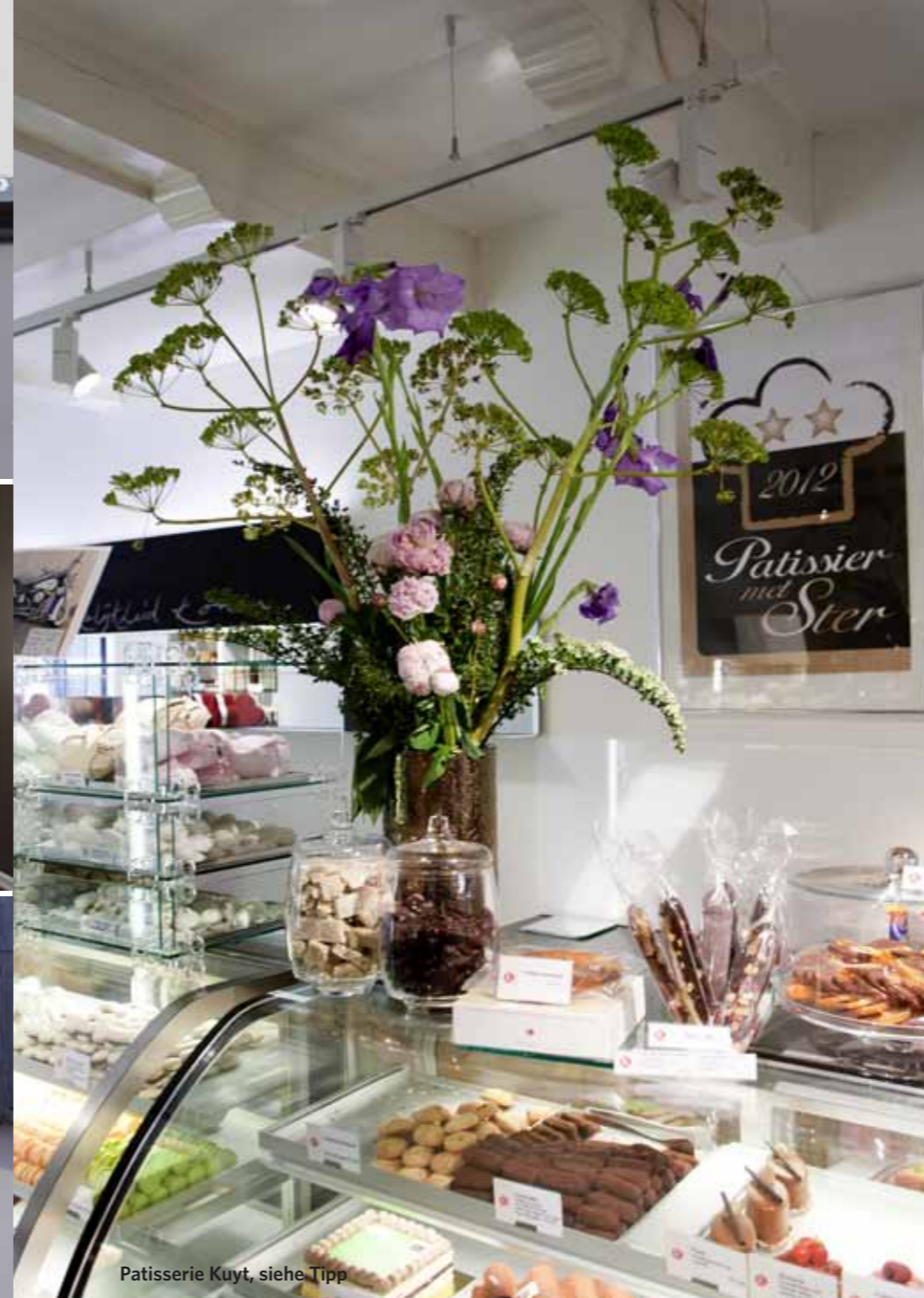
Pâtisserie Kuyt, siehe Tipp