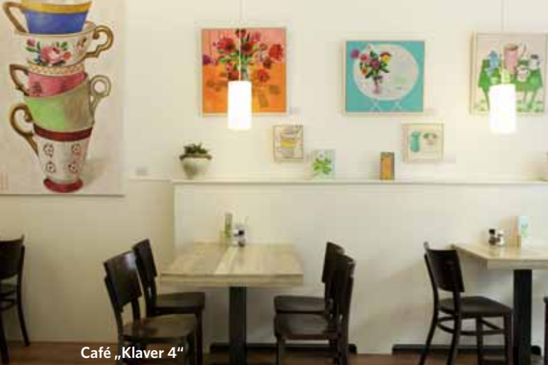
Café „Klaver 4“